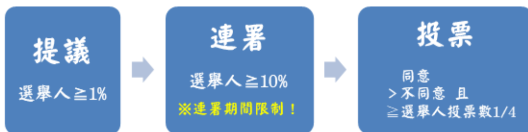
圖2：公職人員罷免程序