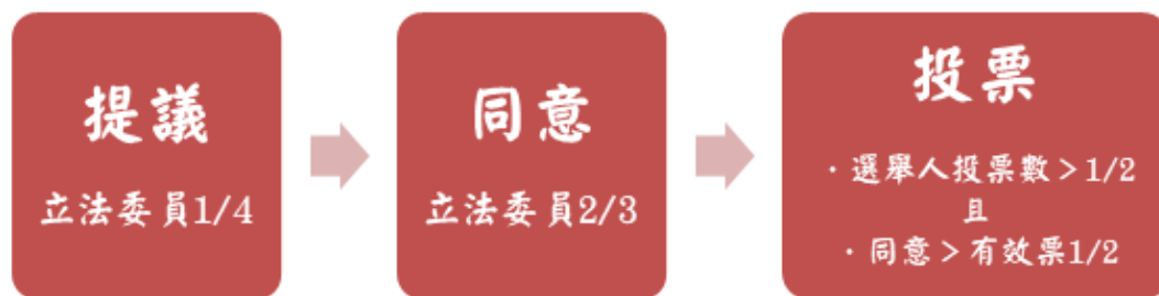
圖1：總統副總統罷免程序