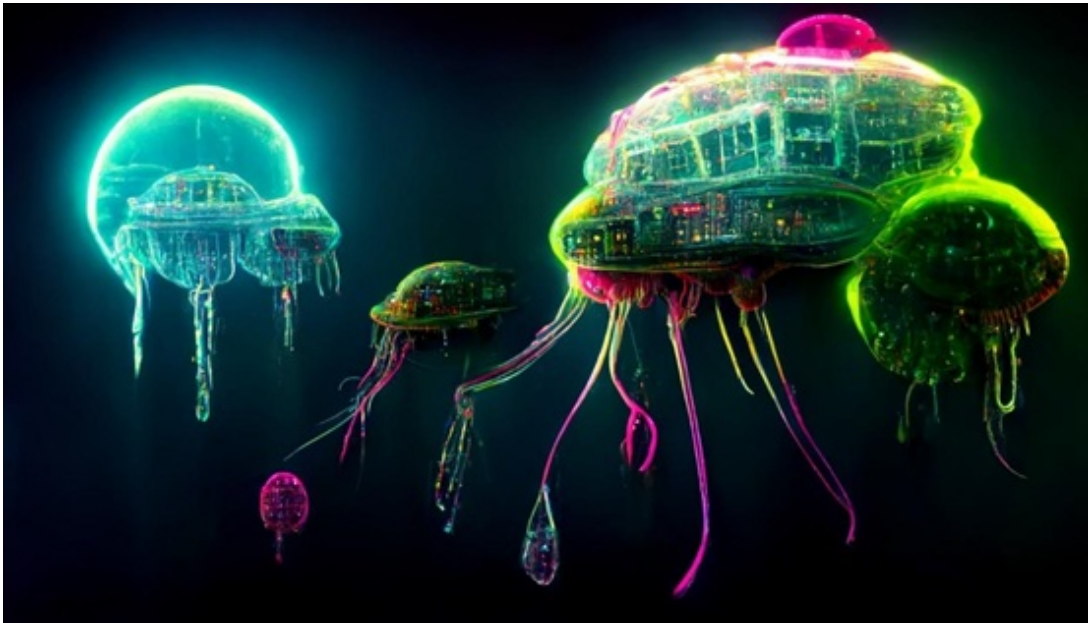
圖1：作者利用Midjourney製作的圖