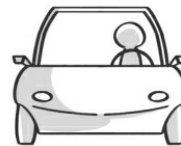
④ 汽、機車等動力車輛的駕駛人 民法 § 191 之 2