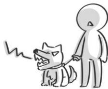
① 動物占有人 民法 § 190