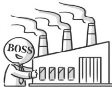
③ 商品製造人或進口業者 民法 § 191 之 1