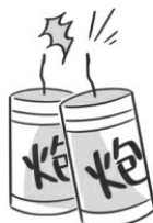
⑤ 從事危險工作或活動的人 民法 § 191 之 3