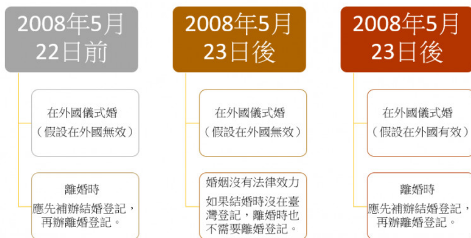
圖3 不同時間在外國儀式婚，在我國如何離婚