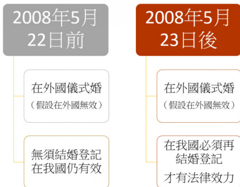
圖2 在外國儀式婚，我國的生效時間

從以上的規定來看，在2008年5月22日以前，我國人民就算曾在國外公開舉行婚禮，只要符合當時我國「儀式婚」的規定，就算回臺灣後未辦理結婚登記，仍屬有效婚姻（圖2） [4] 。