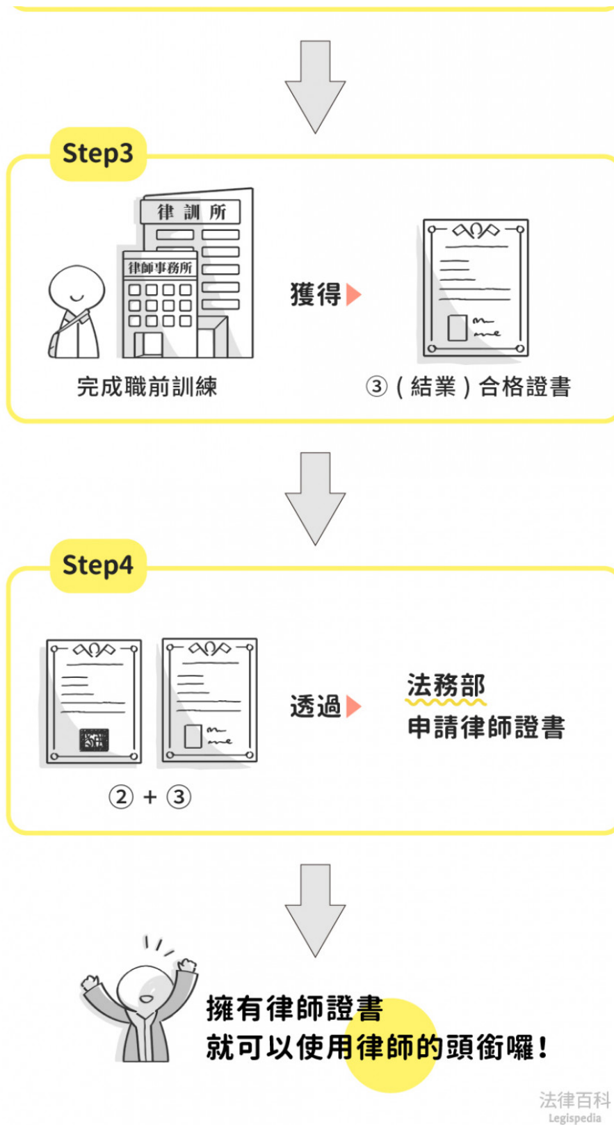
圖1 成為正式律師之路