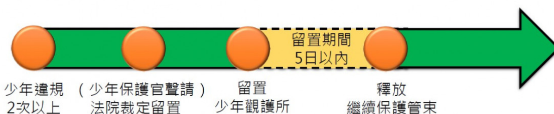
圖3：留置觀察的時序

少年於保護管束期間不服規定達2次以上，有觀察的必要時，少年保護官得依少事法55條第3項請求法院裁定 [6] ，使少年在少年觀護所裡面留置觀察，但最多5日（圖3）。