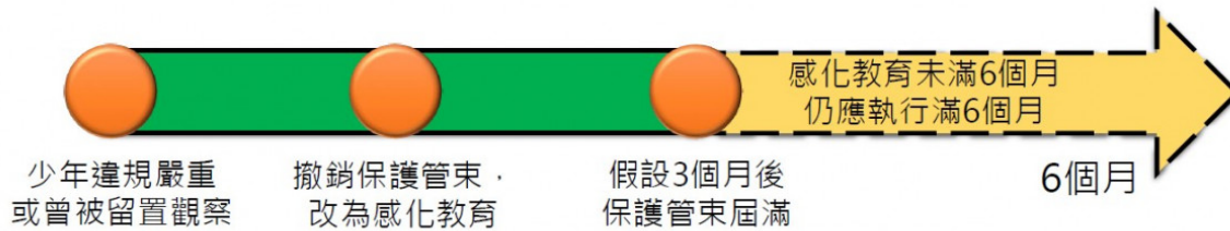
圖4：改施以感化教育的期間