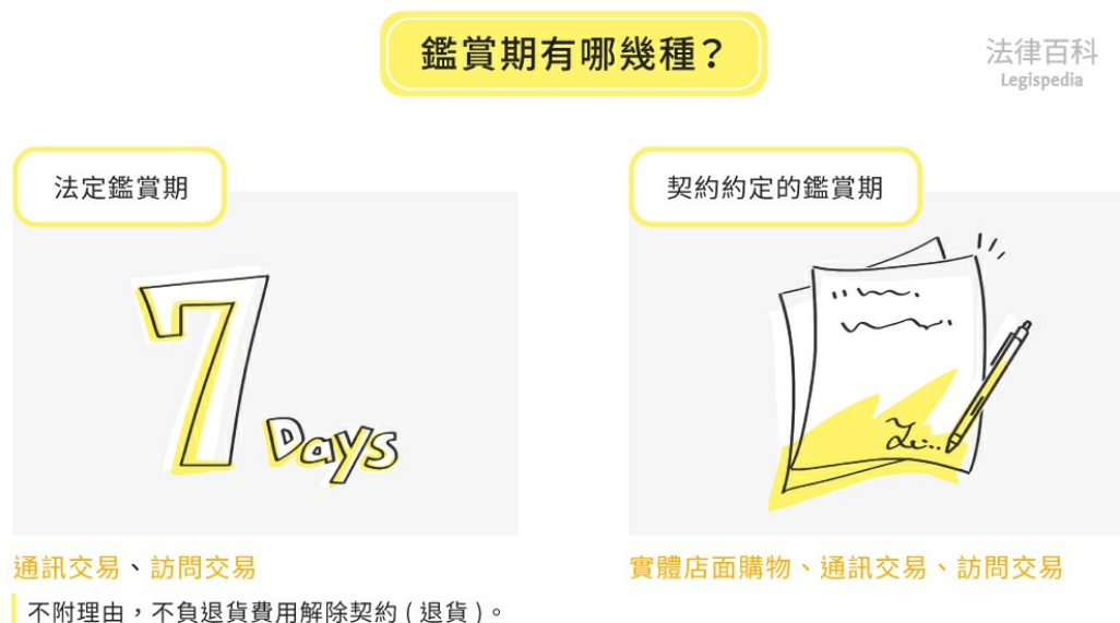
圖1 鑑賞期有哪幾種？

鑑賞期，是指消費者購買商品或服務後，可以在一定期限內退貨的權利。鑑賞期可分為法定鑑賞期與契約約定的鑑賞期：（見圖1）